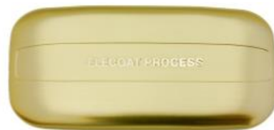
Satin Champagne Gold