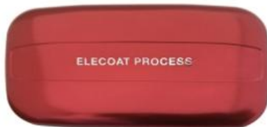
Satin Bordeaux Red