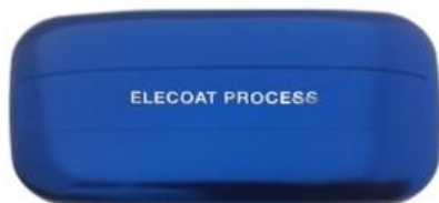
Satin Prussian blue